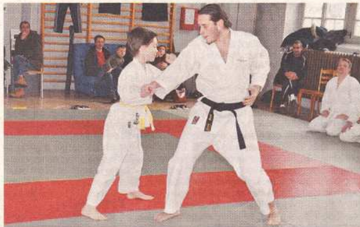
David contre Goliath.