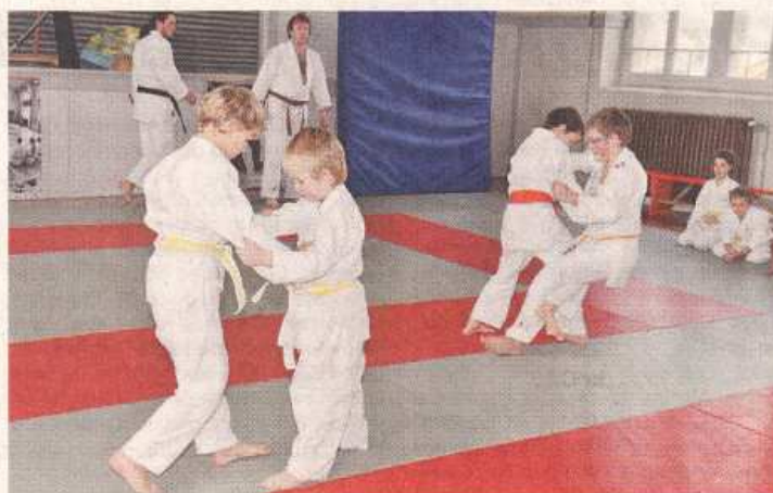
Le judo, une discipline des arts martiaux propice à l'épanouissement des enfants.